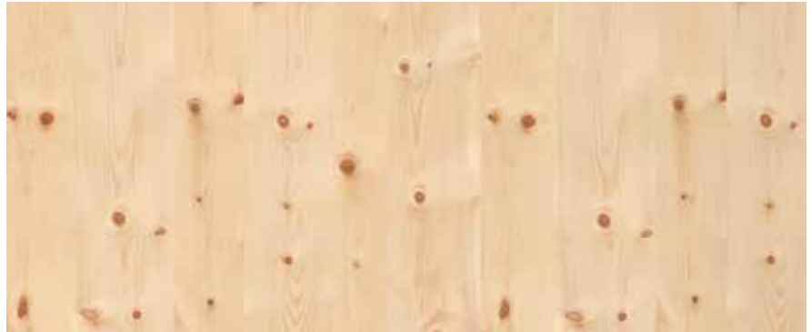
Zirbe / Arve N